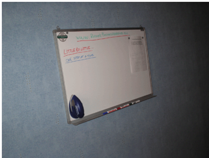
Домашний «уголок мозгового штурма» ☺